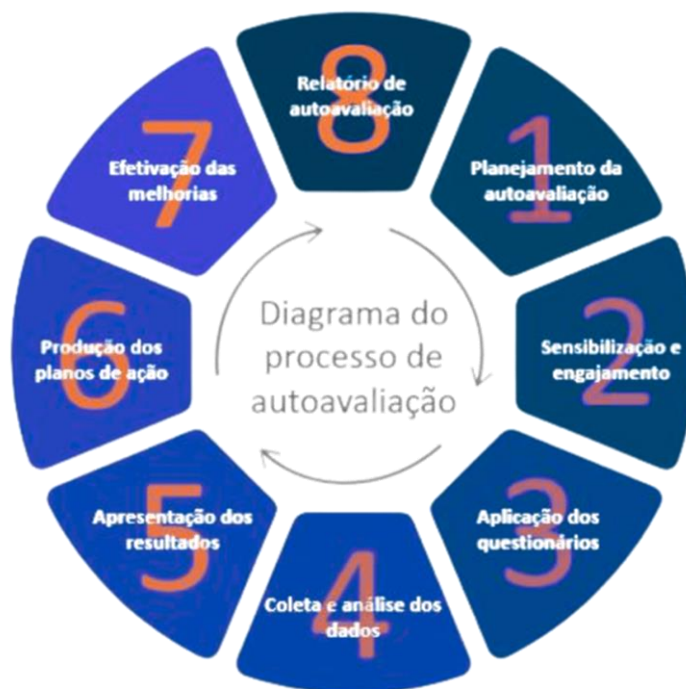
Figura 2 - Fluxograma do Processo de Autoavaliação